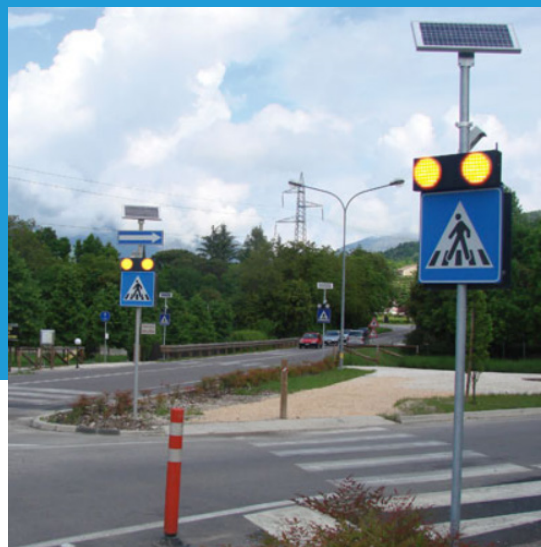
Opozorilne LED utripalke s senzorjem

Pametni sistem označitve prehoda za pešce z uporabo detektorja pešcev ali vozil in LED utripalk v različnih izvedbah. Sistem opozarja voznike na prisotnost pešcev in jim omogoča varnejše prečkanje prehoda.